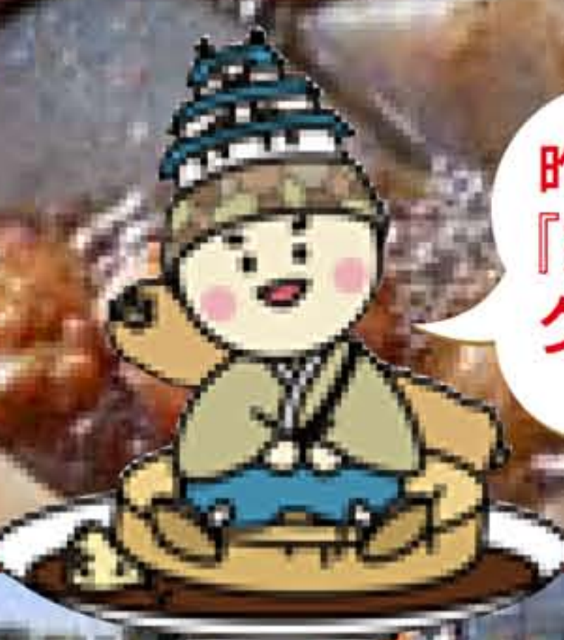
◎ 姫路おでんキャラクター 「しよちゃん」