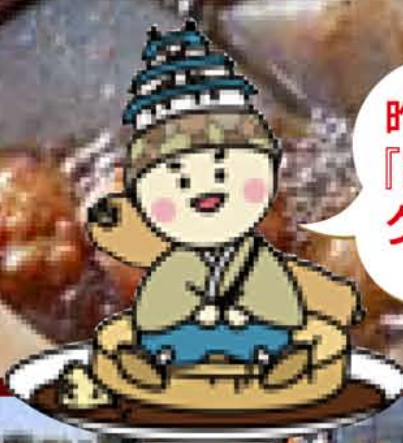
◎ 姫路おでんキャラクター 「しよちゃん」